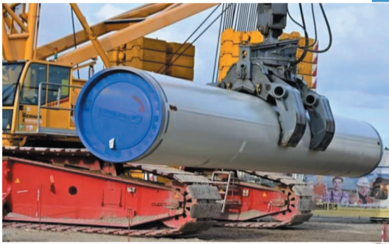
▲ 这是2019年3月26日在德国卢布明拍摄的“北溪-2”天然气管道项目施工现场的资料照片。