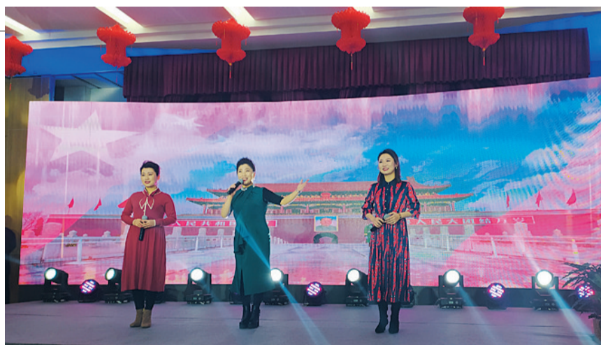
29日，全市劳模工匠新春联谊会在大同工匠学院多功能厅举行。平时忙碌在矿山、高铁、环卫等战线的劳模工匠代表齐聚一堂，共话劳动之美。

我省高等教育自学考试每年举行两次，时间为4月、10月。2021年4月考试时间为4月10日至11日，报名时间为3月上旬；10月考试时间为10月16日至17日，报名时间为8月下旬。此外，我省高等教育自学考试报名于2020年起启用“山西自学考试信息服务平台”，考生需仔细阅读《山西省高等教育自学考试网上报名流程》等相关材料，按要求进行报名流程。考生首次报名后，只能有一个准考证号，在报名地区参加自学考试。因工作调动、学校毕业等原因，需要在本省跨市变动考试地点的考生，需要到当地自考部门办理省内转考手续，无需更换准考证号。