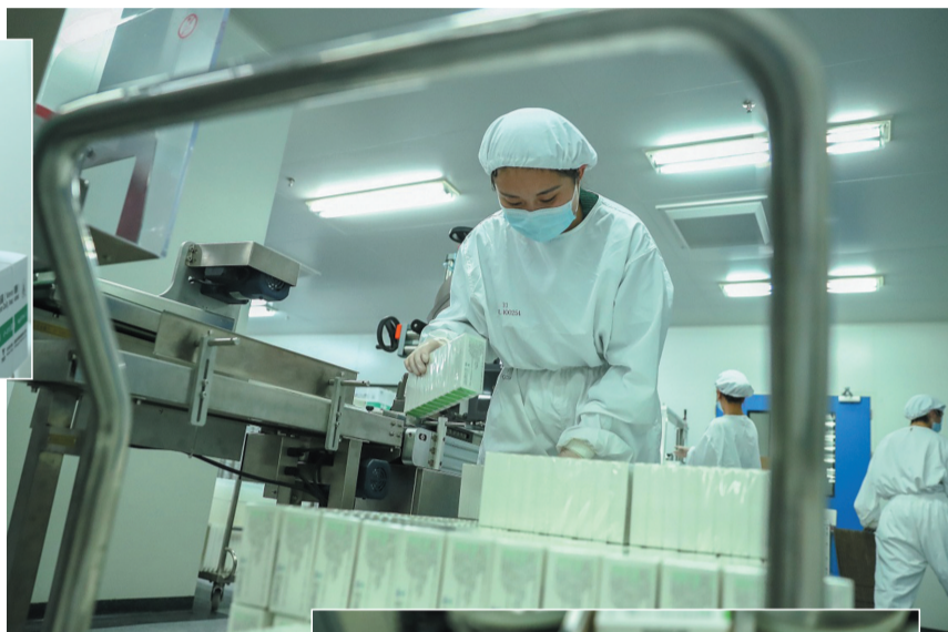
▶ 2020年12月25日,工作人员在国药集团中国生物北京生物制品研究所的新冠病毒灭活疫苗分包装车间内工作。