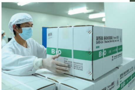
▲ 2020年12月25日,工作人员将新冠病毒灭活疫苗打包装箱。