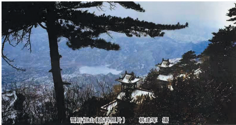
雨后恒山(资料照片)

1949年1月1日，张剑扬出生在浑源县下疃村。该村位于恒山脚下，站在村头极目远眺，恒山胜景尽收眼底。孩童时期的张剑扬未曾想到，每天耸立在眼前的这座大山会是自己一辈子的牵挂。