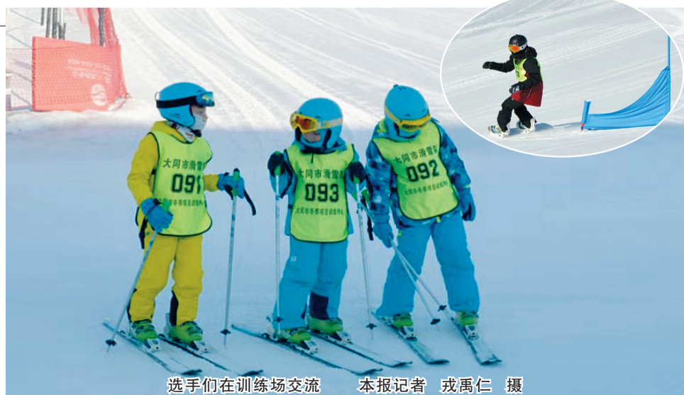
选手们在训练场交流

据了解，我市组建起的单板和高山滑雪队将利用双休日和寒假开始集训，通过重点培养，为备战“2022年省运会”、中国青少年滑雪大奖赛及全运会做准备。目前，我市滑雪运动队第二批招生选拔工作也在有序准备中。