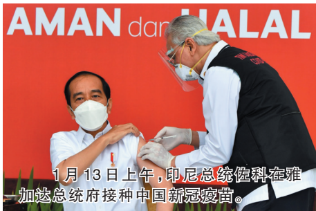
1月13日上午，印尼总统佐科在雅加达总统府接种中国新冠疫苗。

1月13日上午，印度尼西亚总统佐科在雅加达总统府接种了中国科兴公司的克尔来福新冠疫苗，并在电视直播中展示了自己接种疫苗的过程。他是印尼国内接种新冠疫苗第一人。