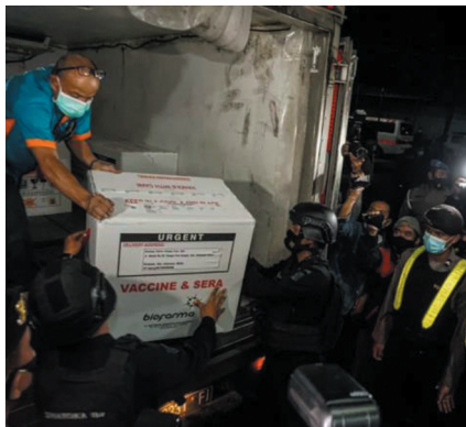
▲ 1月5日凌晨，在印度尼西亚巴厘省登巴萨市，人们搬运刚刚运抵的新冠疫苗。自1月4日起，印尼卫生部开始向全国34个省级行政区分发由中国科兴公司研制的新冠疫苗。

卢胡特表示，印尼和中国是兄弟，衷心希望进一步发展同中国之间良好、可持续的重要合作。印尼感谢中方及时提供疫苗支持，愿同中方继续推进疫苗合作，开展药物研发和医护人员交流。