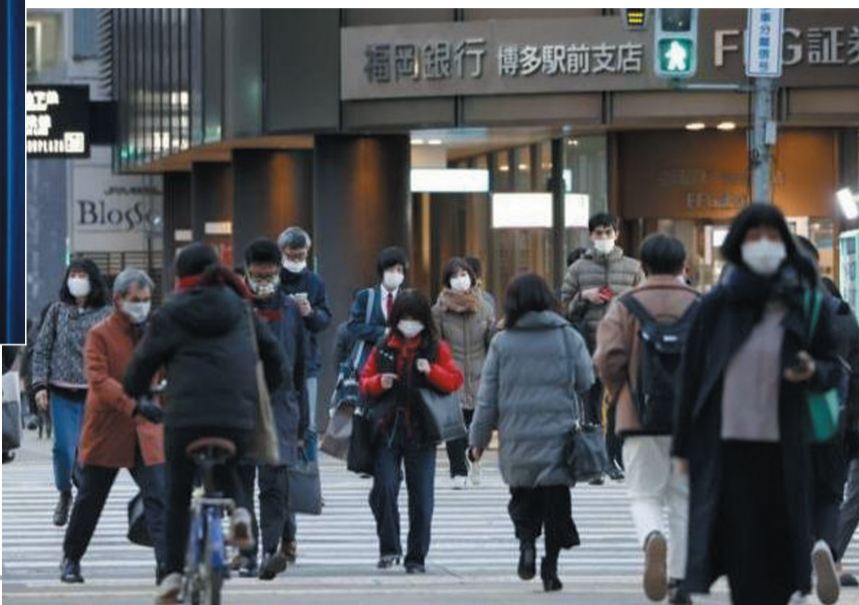
▶ 1月13日,在日本福岡,人们佩戴口罩出行。

日本累计新冠确诊病例13日突破30万例。日本政府当天宣布扩大疫情紧急状态范围,同时将暂停允许部分国家和地区商务人士入境的政策。