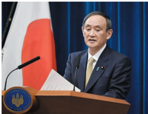
▲ 1月13日,在日本东京,日本首相菅义伟在记者会上宣布日本再有7府县进入紧急状态。