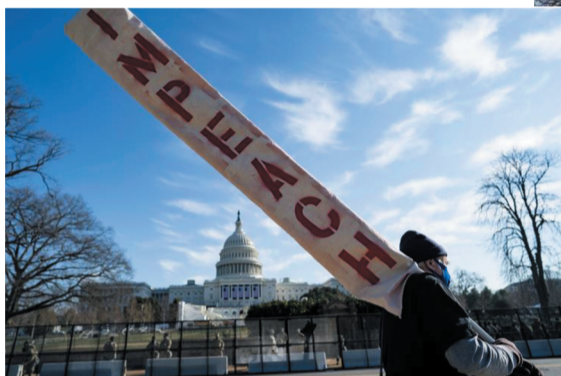
▲ 1月13日，在美国首都华盛顿，一名手持“弹劾”标语的男子从国会大厦前走过。

美国国会众议院13日表决通过针对总统特朗普的弹劾条款，指控他“煽动叛乱”，这距离他卸任仅剩一周。特朗普成为美国历史上首位两度遭到弹劾的总统。美国舆论认为，再度遭弹劾重创特朗普的形象和影响力，但弹劾也是一把“双刃剑”，将进一步激化民主、共和两党之间的矛盾，进一步加剧美国社会的撕裂。