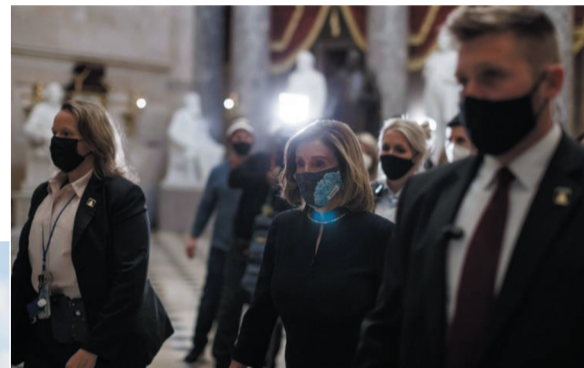
▲ 1月13日，在美国首都华盛顿，国会众议院议长佩洛西（前右二）走在国会大厦内。