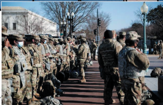
▶ 这是1月14日在美国首都华盛顿国会区域拍摄的美国国民警卫队队员。

在俄勒冈州首府塞勒姆，10多名男子身穿军装风格外套，戴着面罩和头盔，斜挎半自动武器。一些人举着倒挂的美国国旗和写有“解除政府武装”的标语。