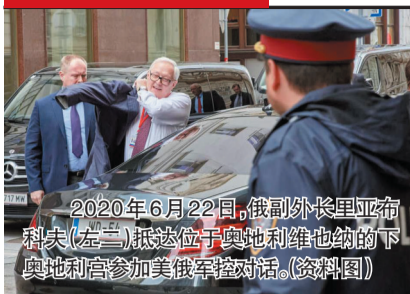
2020年6月22日,俄副外长里亚布科夫(左二)抵达位于奥地利维也纳的下奥地利宫参加美俄军控对话。(资料图)