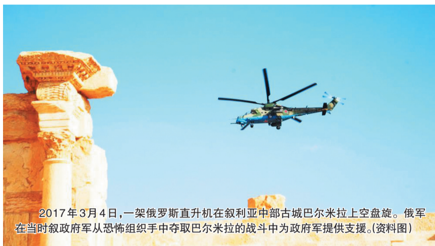
2017年3月4日,一架俄罗斯直升机在叙利亚中部古城巴尔米拉上空盘旋。俄军在当时叙政府军从恐怖组织手中夺取巴尔米拉的战斗中为政府军提供支援。(资料图)

美国新总统拜登领导的政府本月20日上台后,一改特朗普政府的冷淡态度,第二天便做出上述积极表态,使这份将于今年2月5日到期的条约被延长的可能性大大增加。有分析指出,从时间上来看,美俄