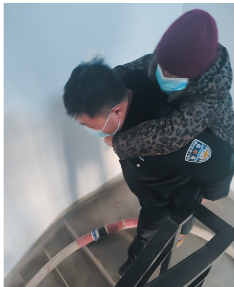
民警背着行动不便的老人下楼

本报讯(记者郑林)1月24日,平城区金色水岸·龙园一住户家中着火,平城公安分局北街派出所民警接到报警后迅速出警,与消防、物业多部门配合成功扑灭火灾,最大限度保障了居民的人身财产安全。