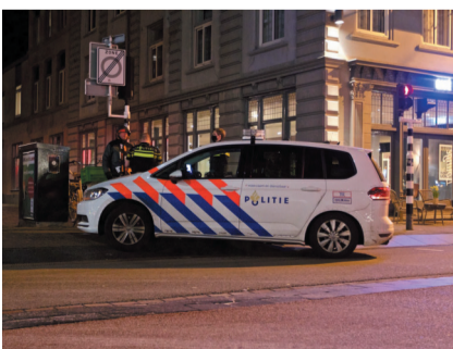
1月23日, 在荷兰哈勒姆, 警察在宵禁后的街头执勤。

反对荷兰政府实施宵禁等防疫措施的部分示威活动24日转为暴力及违法活动, 荷兰执法部门当天在全国抓捕超过240人。