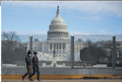
▶ 1月24日, 在美国首都华盛顿, 人们戴着口罩从国会大厦附近经过。