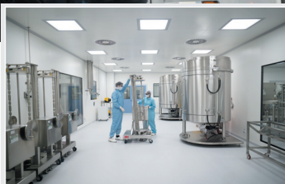
▲ 2020年8月14日，在阿根廷布宜诺斯艾利斯省加林市的新冠疫苗研究实验室内，科研人员为生产由英国牛津大学和阿斯利康制药公司合作研发的新冠疫苗做准备。（资料图）