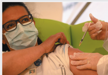
▲ 2020年12月28日，在意大利罗马一家医院，一名医护人员接种由美国辉瑞制药有限公司与德国生物新技术公司联合研发的新冠疫苗。（资料图）

德纳公司研发的疫苗、英国阿斯利康制药有限公司与牛津大学合作研发的疫苗、俄罗斯研发的“卫星V”疫苗，还有中国国药集团、科兴公司等企业研发的疫苗已在多个国家和地区启动大规模接种。