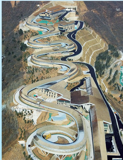
国家雪车雪橇中心