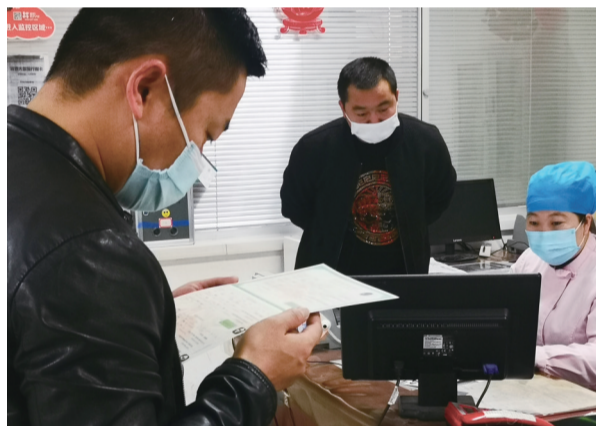
新生儿家长正在办理《出生医学证明》。

在具有助产技术服务资质的医疗保健机构内出生的新生儿，以及在家中或途中急产分娩后送该机构进行断脐处理的，原则上由新生儿母亲向该机构申领《出生医学证明》。在具有助产技术服务资质的医疗保健机构外出生的新生儿，由新生儿父母或其监护人向拟落户地县（市、区）卫生健康行政部门或其委托管理机构申领《出生医学证明》，申领时应提供新生儿父母有效身份证件原件、复印件；亲子关系声明、具有资