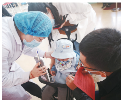
专家为小宝宝进行耳部检查

要的是要养成安全用耳好习惯，生活中耳朵出现问题要及时诊治，切勿耽误了病情。对于青少年和年轻人，戴耳机要注意，音量过大容易导致听力下降，长时间大音量会对耳神经造成损伤；老年人多有耳鸣不适症状，通常伴随听力下降。引起耳鸣的原因有多种，老年人多与高血压、糖尿病、血管性疾病以及听力下降等有关，需到医院做准确检测并进行针对性治疗。