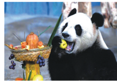
国宝就是国宝,连吃东西都那么萌。