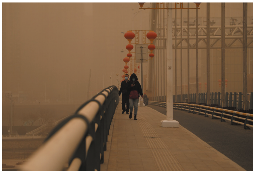
3月16日,行人走过兰州元通大桥。

16日,兰州至北京、上海、西安、喀什、敦煌等地航班延误或取消。截至16日11时,前期公路交通管制均已解除,收费站恢复正常运行。