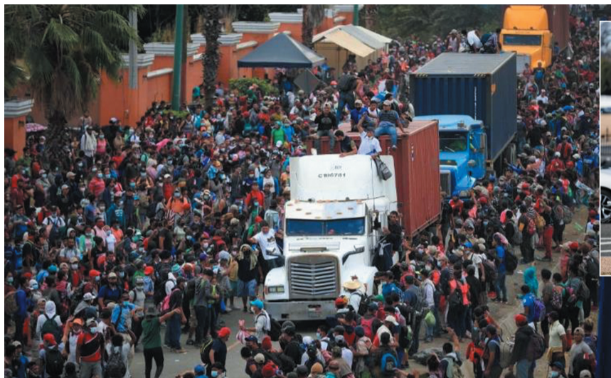
▲ 1月18日，在危地马拉奇基穆拉省靠近洪都拉斯的边境小镇巴多翁多，大批中美洲移民聚集在一条道路上。(资料图)

与政府官员、民间团体和非政府组织代表会面，讨论如何解决这一地区民众产生移民想法的“根本原因”，为这一地区搭建“更有希望的未来”。