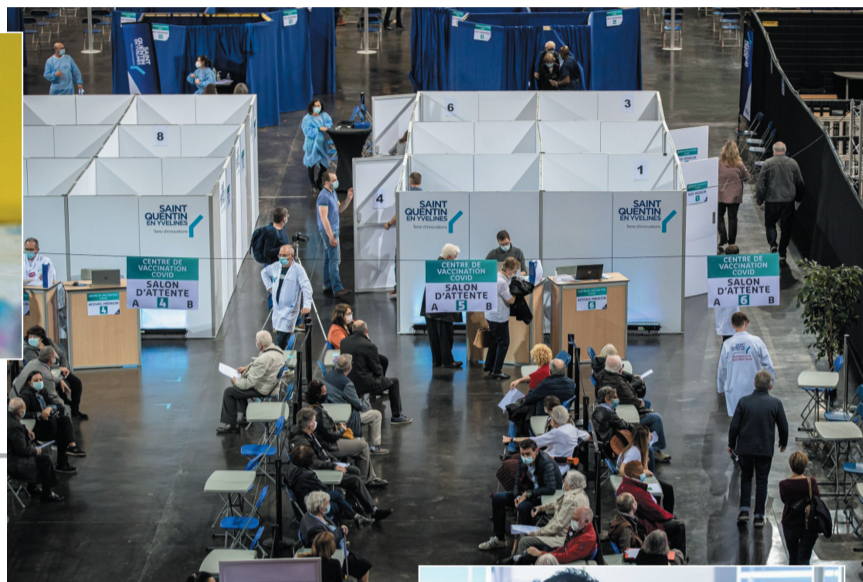
▲ 3月24日,人们在法国圣康坦-昂伊夫林一家体育馆设立的新冠疫苗接种中心等待接种疫苗。法国总统马克龙23日宣布将加紧推进全国性的新冠疫苗接种计划,措施包括设立35个大型疫苗接种中心。