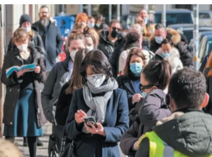
3月22日,顾客在德国首都柏林排队等候进入商店。

不少行业及商家强烈反对这一措施,理由是这将进一步重创德国经济;一些公共卫生专家则认为措施“不够严