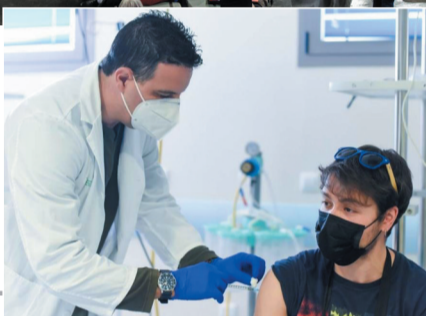
▲ 3月24日,一名男子在西班牙卡塞雷斯省科里亚市医院接种阿斯利康疫苗。当日,西班牙重新开始使用阿斯利康疫苗。由于担心可能引发血栓,西班牙于3月15日暂时停止使用阿斯利康疫苗。

欧洲联盟委员会24日修订新冠疫苗出口管理规定,强化管控。稍后,欧盟与英国发表联合声明,就新冠疫苗供应表示要实现双方“共赢”。