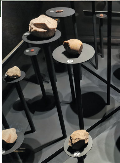
许家窑遗址出土的石制品

“沧桑代地”展厅内,以实物、多媒体等各种不同形式,活灵活现地展示了许家窑人在山林和水泽飞索投石捕杀猎物,用打制过的石器切割兽皮,将兽肉或投于火堆或架于火堆之