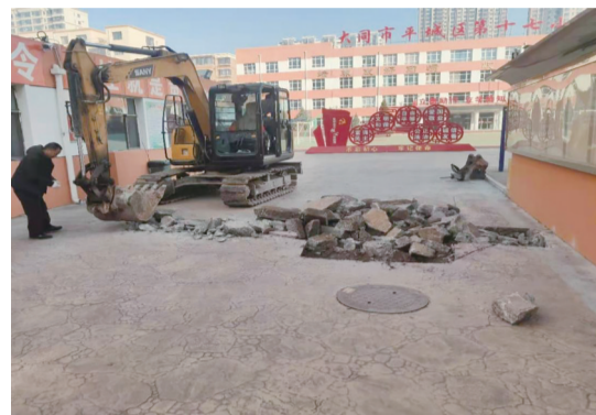
17小家属楼自来水管维修现场

“学习党史更重要的是要主动为民解难事、办实事,切实为群众解决问题。”永泰街相关负责人表示,街道随时关注辖区居民的民生问题,不断提升社区工作者为民服务意识,切实跑出为民服务“加速度”。