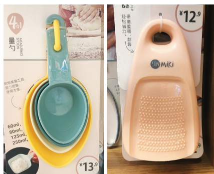
五彩斑斓的量勺和粉粉嫩嫩的蒜蓉器

剪刀、蒜蓉器、果蔬刨、红酒开瓶器、量勺……是每个家庭都少不了的实用小工具,其传统的外观和材质也以简单的不锈钢或者其他金属材料为主,它们如此不起眼,所以多数情况下,都会被搁置在厨房或者抽屉的角落里,直到用时才被想起。而如今随着八零、九零甚至零零后日渐成为消费的主力军,他们对于一件工具的选择也不再停留于对功能和实用的满足,而更加侧重对美观的要求,于是与这种消费心理相吻合的美美哒的工具来了……一把剪刀有了白色的外衣,一套量勺有了五彩斑斓的色彩,即使一个蒜蓉器也有着粉粉嫩嫩的外形,所有这些变化让我们即使在选购一件工具时也会得到一次美的熏陶。 晓澜