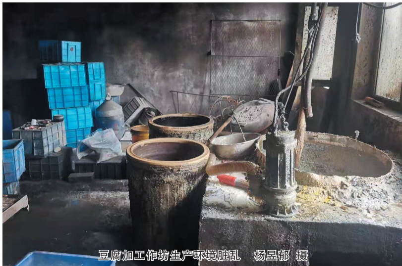
豆腐加工作坊生产环境脏乱

次日,平城区环境治理监督大队执法人员再次来到该豆腐加工作坊回访,发现作坊已自行搬离。