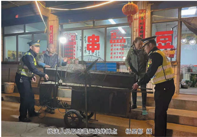
执法人员取缔露天烧烤摊点

截至目前,该队共摸底、走访百余家烧烤经营户,对5家未开启油烟净化设备的商户,执法人员现场下达《责令整改通知书》,令其限期整改。