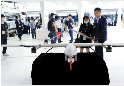
▲5月7日,参观者在一款无人机展品前驻足观看。

天科工集团、中国电子科技集团等单位带来的多款新装备,也集中展示了国产应急救援装备研发的创新成果和科技力量。