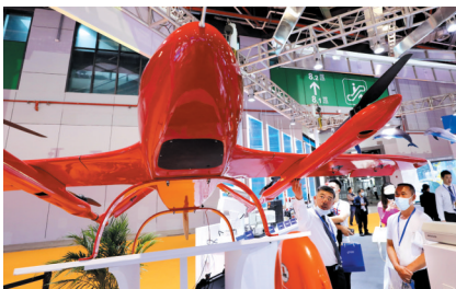
▲5月7日,工作人员(左)向参观者介绍一款长航时垂直起降固定翼无人机展品。