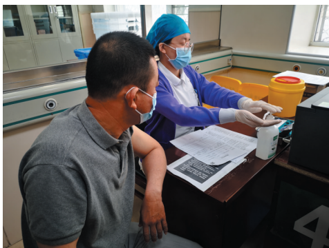
接种前进行手消毒