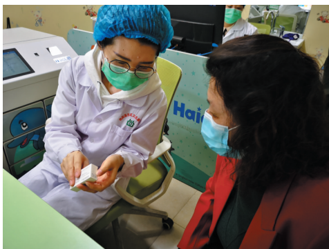
与受种者核对信息