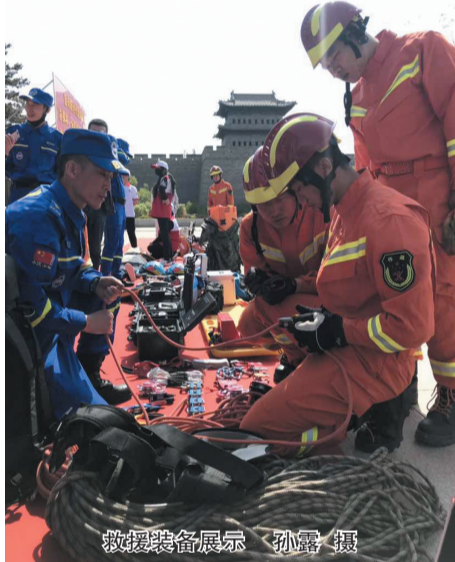
救援装备展示

活动现场还展示了无线电应急通讯设备、水域救援装备、救生装备等，专业救援人员讲解演示创伤包扎、心肺复苏、AED除颤器使用以及应急处置等救护实战操作，并邀请市民现场参与互动教学，普及推广全民防灾减灾自救技能。