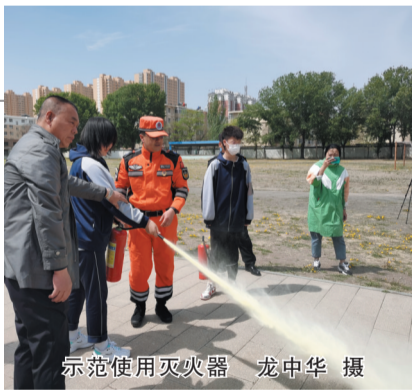
示范使用灭火器