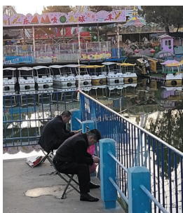
公园内,违禁钓鱼、放养宠物、折损花木的行为时有发生。