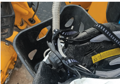
共享电动车的头盔破损

本报讯(记者 刘剑)为方便市民安全出行,从今年3月起,恒安新区街头停放的共享电动自行车都配备了头盔。可这些共享头盔上岗没多长时间,就有不少丢失或损坏。此外,满是泥土的共享电动车的头盔让骑行的市民实在不想戴。