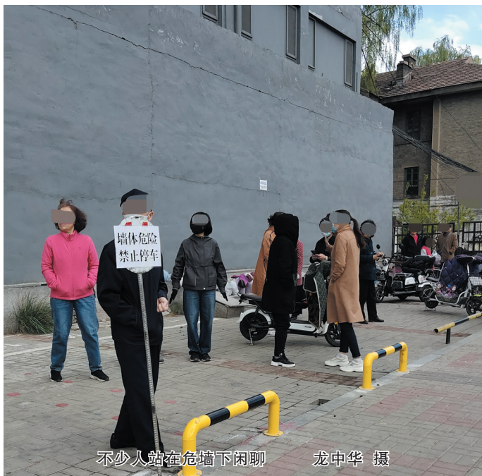
不少人站在危墙下闲聊

16日15时许，市公安局巡特警支队一大队一中队接110指挥中心指令称，平城区振华路附近一名男子躺在路边。接到指令后，民警快速到达现场，发现该男子横躺在道路中间，浑身散发着酒味，行动意识不清，民警合力将其扶至警车上。通过走访，民警了解到该男子的家庭住址，在邻居的帮忙下，终与其妻取得联系。30分钟后，待妻子赶回家，民警将男子扶至家中，安置妥当后才放心离开。