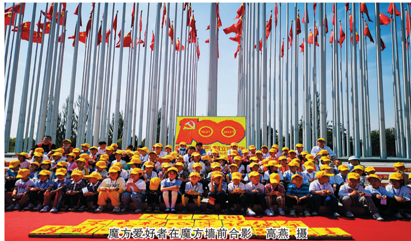
魔方爱好者在魔方墙前合影

据了解，参与此次活动的魔方爱好者最小的只有3岁，活动前，主办方还对参与活动的青少年学生进行了党史教育，让孩子们了解党的光辉历程，知党情、感党恩，珍惜来之不易的幸福生活。