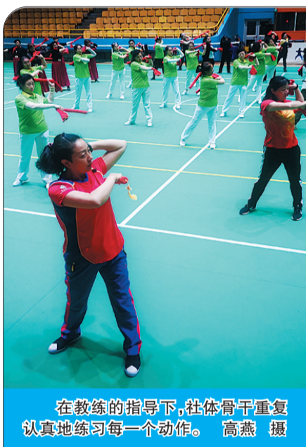
在教练的指导下，社体骨干重复认真地练习每一个动作。

此次双方合作，将有力拓展医疗卫生人才学习实践、专业深造以及对口就业渠道，促进医院管理水平、医疗技术和提升，同时以附属医院建设为契机，在重点学科建设等方面开展多领域深度合作。