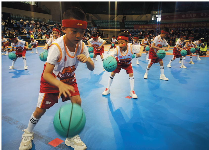
小朋友表演篮球操

此次比赛设篮球操、三人运球接力、三人定时传球、三对三实战等项目，参与者年龄最小的只有4岁，最大的9岁。