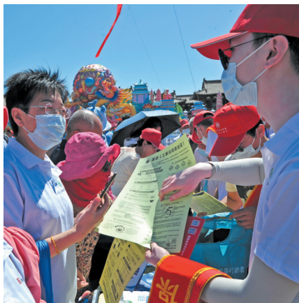
发放宣传资料

本报讯（记者 张志忠）5日上午，在阵阵威风锣鼓声中，由大同市生态环境保护委员会主办，市生态环境局承办，纪念第50个“世界环境日”暨大同市生态环保宣传周启动仪式在华严广场隆重开幕，长期关注并支持环保事业的社会各界人士来到活动现场，为建设人与自然和谐共生的美丽家园凝聚共识、汇聚力量。