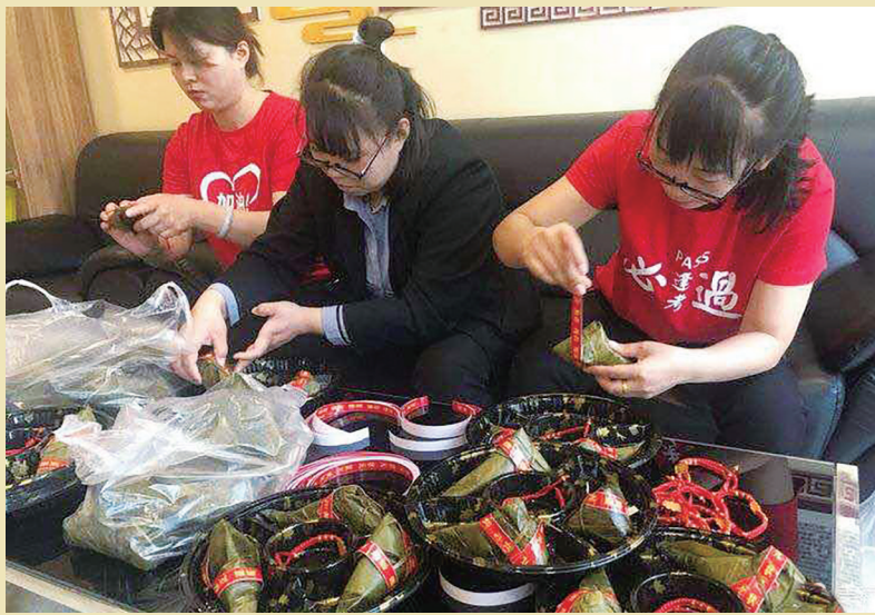
近日,平城区水泊寺街道文源社区组织诚博美居物业工作人员一起包粽子,为辖区考生们准备粽子礼盒。

本次活动体现了端午的风俗,烘托了节日气氛,在保护非遗、传承非遗和振兴大同本土传统工艺方面做出了积极贡献。永安社区将持续举办此类活动,丰富居民的生活。