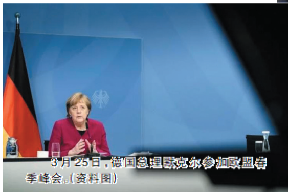
3月25日,德国总理默克尔参加欧盟春季峰会。(资料图)