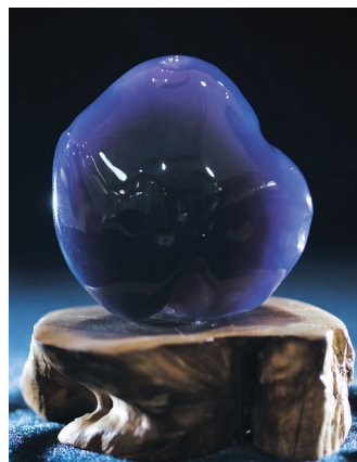
▲大同紫玉原石 未经切割，现如今如此大的紫玉原石已不多见。