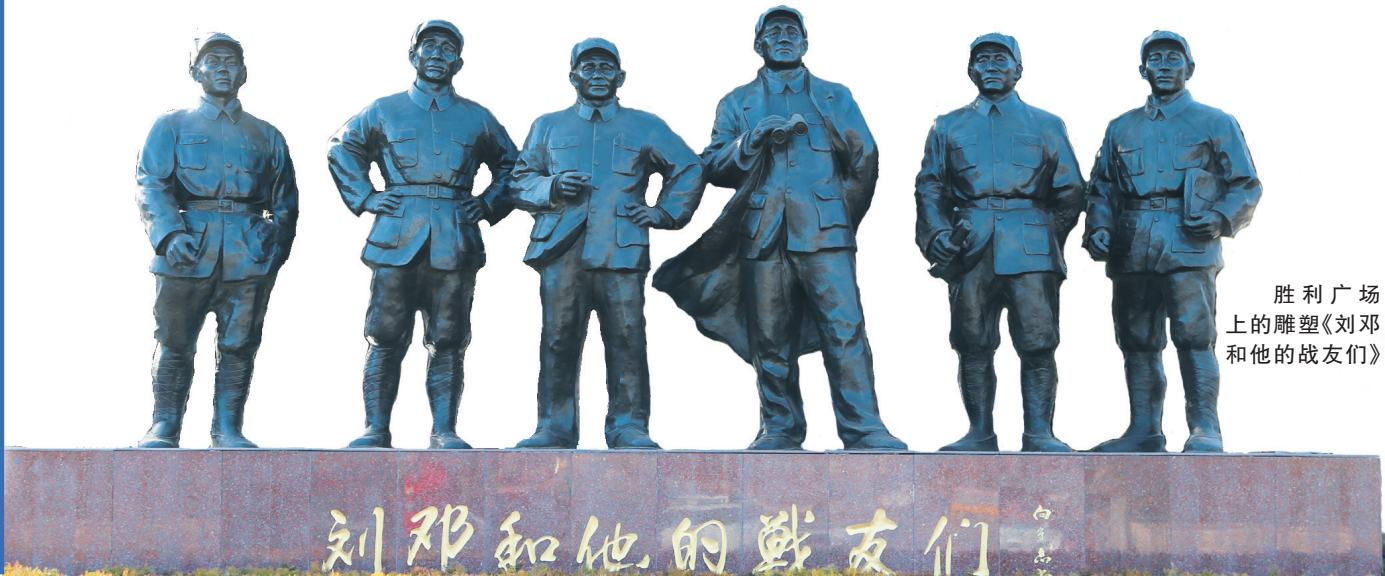
胜利广场上的雕塑《刘邓和他的战友们》