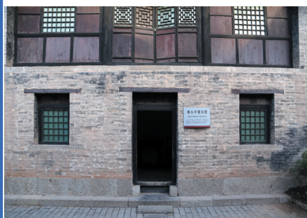
邓小平居住办公达5年之久的宿舍