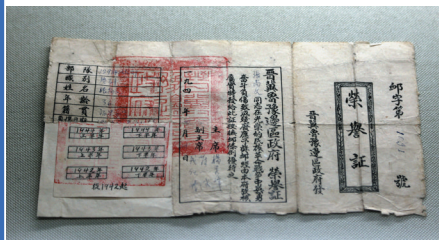
陈列馆展出的军人负伤致残荣誉证