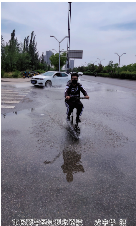
市民骑车经过积水路段