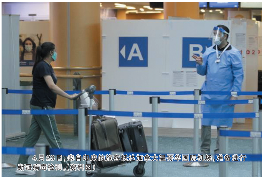
4月23日,来自印度的旅客抵达加拿大温哥华国际机场,准备进行新冠病毒检测。(资料图)

范凯尔克霍弗指出,苏格兰的一项最新研究提出,德尔塔毒株有可能增加患者入院治疗的风险。但这只是在单一国家开展的一项初步研究,结论还需进一步验证。目前还没有迹象表明德尔塔毒株会导致新冠致死率上升。