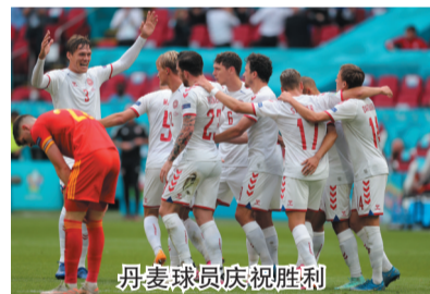
丹麦球员庆祝胜利

欧洲足球锦标赛十六强赛27日进行了首场较量,丹麦队在阿姆斯特丹4:0战胜威尔士队晋级八强,丹麦前锋多尔贝格独中两元。