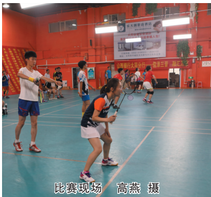
比赛现场

本报讯（记者 高燕）日前，由市政府主办的全市群众文化活动“山西银行杯”羽毛球赛落幕，来自全市32支代表队的300余名羽毛球爱好者参赛。