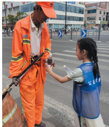
小朋友向环卫工、快递小哥赠水

“与孩子共同参与公益活动特别有意义，让孩子感受到户外劳动者的不易，这对孩子的成长很有帮助。”参与活动的一位家长说。