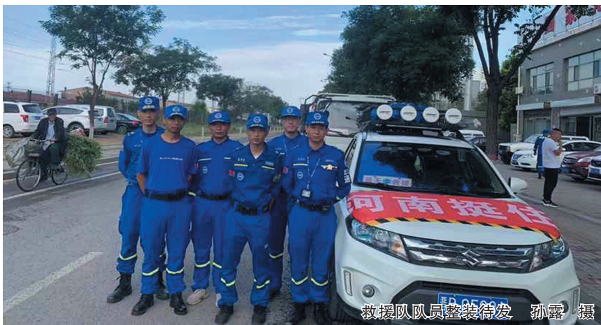
救援队队员整装待发

本报讯（记者 孙露）7月27日早晨，大同蓝天救援队集结第二批驰援河南的6名出征队员，带着团市委募集的