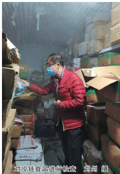
对冷链食品进行检查

本报讯（记者 刘剑）为全面加强疫情防控安全保障，及时发现漏洞、堵塞监管缺口、消除安全隐患，1日，市市场监管局执法人员组成11个督查组，采取明查暗访方式就防疫药品登记和使用、销售、储存进口冷冻冷藏肉品（含水产品）情况进行督查。