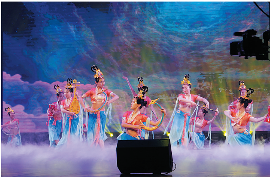
朱锦设计的《云冈伎乐天舞》服饰

蓝底白花的布面上，大佛眉眼细长，双耳垂肩，嘴角上扬，表情严肃庄重却又慈祥和蔼。用蜡刀蘸蜡绘花于布后以蓝靛浸染，既染去蜡后，垂目微笑的大佛跨越千年，以原始古朴的方式来到观者眼前。看似朴实的作品，每一个花纹都值得细细品味，蓝与白的结合，给人以宁静高雅的艺术之感。