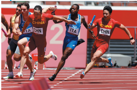
中国男子接力队在预赛中