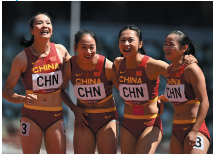
中国女子接力队庆祝胜利