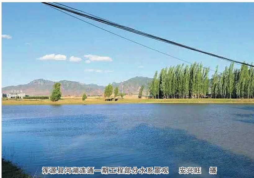
浑源县河湖连通一期工程部分水系景观

本报讯（记者 崔莉英）近日，不少到浑源的游客发现，该县外围有了绕城水系景观。记者昨日从浑源县了解到，该县大型水利工程河湖连通一期工程日前完工并开闸放水，这一水利工程为古城浑源增添了河湖绕城的自然生态景观，也为当地居民和游客提供了更多亲水空间。