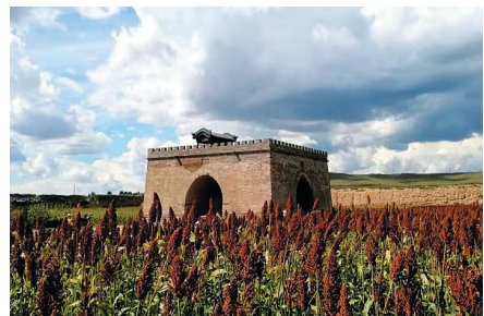
修缮后的得胜堡玉皇阁基座