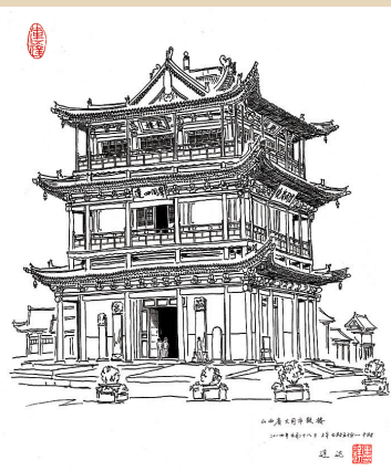
连达大同古建写生作品——鼓楼