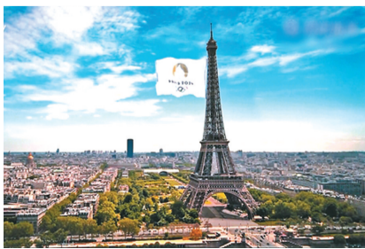
以埃菲尔铁塔为旗杆,奥林匹克五环旗飘扬。