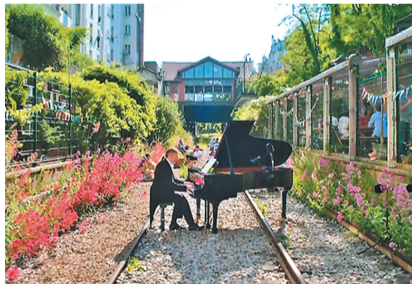
钢琴家在废旧铁路上演奏,这是巴黎旧车站改造的居民公共活动区。