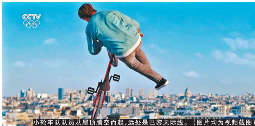
小轮车队员从屋顶腾空而起,远处是巴黎天际线。(图片均为视频截图)

8月8日晚,第32届夏季奥林匹克运动会在东京闭幕。按照惯例,下届奥运会东道主所负责的八分钟表演,通常是整个闭幕式最令人期待的环节之一,这次也不例外——第33届夏季奥林匹克运动会将在法国巴黎举行,“巴黎八分钟”惊艳亮相。