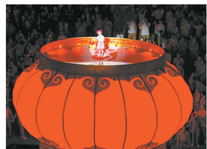
大红灯笼为舞台,女孩演唱《茉莉花》。

“北京八分钟”可谓集中华文化之大成。第一段,带来具备民族特色的歌舞表演,14名中国女孩拿着琵琶、二胡、手鼓等乐器演奏《茉莉花》;第二段,穿着民族服装的武术演员登场展示中国功夫;第三段,戏曲学校的小演员登场带来京剧表演。最后,一位小女孩登场,手提灯笼演唱《茉莉花》,一曲唱罢,喊出“Welcome to Beijing”。