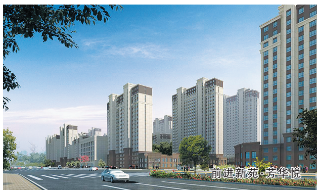
文瀛御湖湾,面湖而开

今年以来,环湖区域成为我市楼市的热点区域,众多房企在这里展开火热的争夺战。文瀛御湖湾项目便是今年环湖区域涌现的楼市“新秀”。