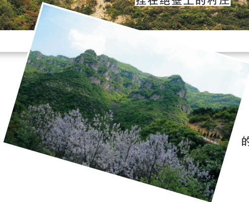
岳家寨里的太行风情