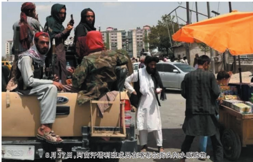
8月17日，阿富汗塔利班成员在喀布尔街头向小贩购物。