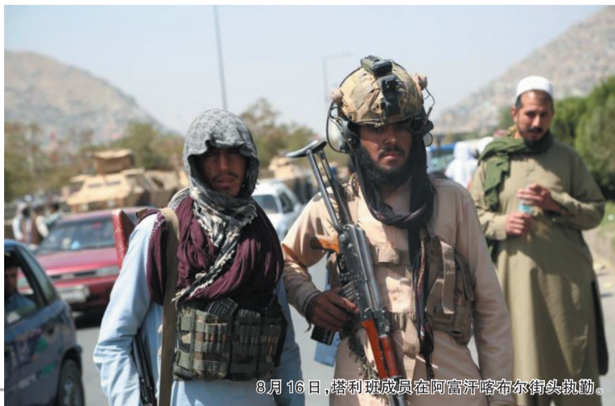
8月16日，塔利班成员在阿富汗喀布尔街头执勤。

当天早些时候，加尼借助社交媒体发布视频讲话，支持阿富汗塔利班与阿富汗政界人士谈判，说他将近期回国。