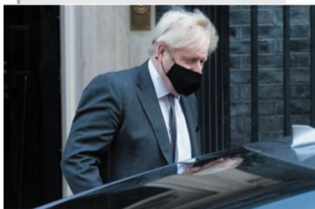
▲ 2020年12月30日，英国首相鲍里斯·约翰逊离开英国伦敦的首相府前往议会。(资料图)