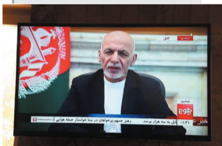
▲ 8月14日，阿富汗首都喀布尔的电视上正在播出阿富汗总统加尼的电视讲话。