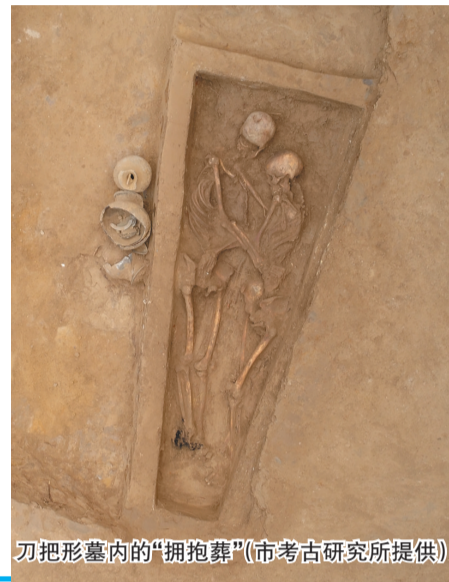
刀把形墓内的“拥抱墓”