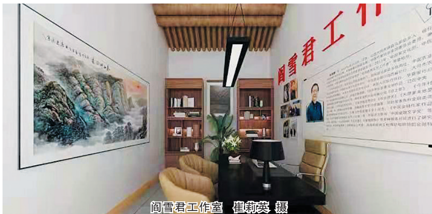
阎雪君工作室 崔莉英 摄

漫步李二口村，可见村民新居布局随地形高低错落，青砖黛瓦，黄泥抹墙，青石漫地，院落整洁，充满古朴的塞北明清风貌。在李二口景区内，已建成天镇历史陈列馆、“石头记”大观园、红色文化记忆馆等多处文化场馆，再加上众多的名人工作室，使得该景区文化气息浓郁，人气满满。